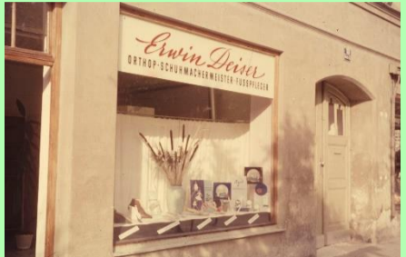
1960: Erster Laden in Ingolstadt Harderstrasse