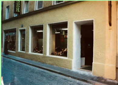
1975: Laden und Werkstatt in der Ziegelbräustraße