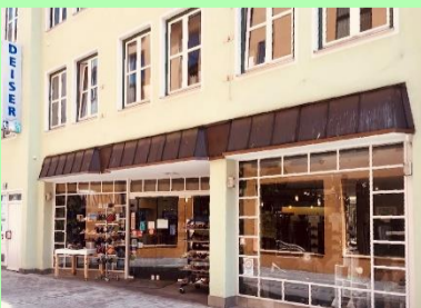
Heute: Zentrale Ingolstadt Ziegelbräustraße