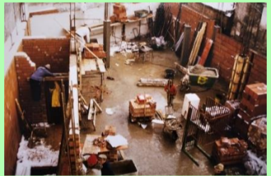
1983: Abriss und Neubau der Firmenzentrale