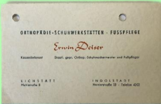
1960: Erste Visitenkarte