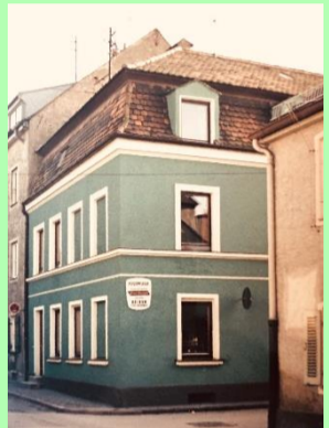
1965: Werkstatt in Ingolstadt Unterer Graben