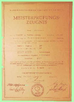
1958: Meisterprüfung in Frankfurt